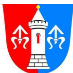
Městys Hustopeče n/B

Od pondělí 10. září začne výuka náboženství ve škole v Hustopečích n/B. V ostatních školách dle domluvy s katechetkami. Děti, které byly přihlášeny v minulém roce, nemusí podávat novou přihlášku – přihlášení platí. Přihlášku vyplní pouze žáci nastupující do 1. třídy, případně noví zájemci. Pokud by někdo nechtěl výuku náboženství navštěvovat, musí se odhlásit. Přesný rozvrh výuky bude v příštím čísle. Předpokládaná výuka v Černotíně – pondělí ve 14 00 hod. a v Bělotíně – pondělí ve 13 00 hod.