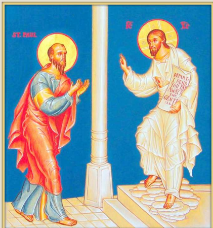
Mystické setkání sv. Pavla s Kristem

Bůh - Stvořitel - se zvláštní láskou a úctou člověka stvořil, vyvolal ho z nicoty k bytí a navíc ho stvořil ke svému obrazu - vyznamenal jej podobností se sebou samým. Načež ho postavil do ráje, do nerušeného a oblažujícího vztahu s Bohem. Jenže člověk si tento rajský vztah neudržel. Tak lehký příkaz - jíst ze všech stromů rajských, nikoliv však ze stromu poznání dobra a zla - porušil. Podlehl pokušení zlého ducha a tím ztratil nejenom blažený stav, ale i možnost dosažení svého životního cíle - nebe.