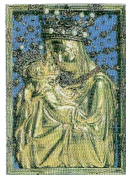
PALLADIUM ZEMĚ ČESKÉ