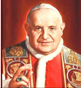
papež Jan XXIII.